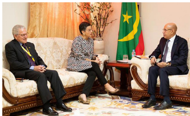
Encuentro entre el presidente de Mauritania, Mohamed Ould Ghazouani y la ministra de Asuntos Exteriores, Arancha González Laya, con motivo de su viaje a Mauritania.- 25 febrero 2020.

Los flujos migratorios o son exagerados pero sí significativos en relación con la población total mauritana y en comparación con otros países. La comunidad mauritana en España se mantiene en cifras estables en los últimos años, con cerca de 10.000 residentes mauritanos, según el padrón del INE. Los visados concedidos por nuestra Embajada en Nuakchot, por su parte, han experimentado un aumento constante en los últimos años de en torno al 10% anual, otorgándose en 2018 más de 9.000 visados para viajar a España. Desde 2011 existe un acuerdo de supresión recíproca de visados en pasaportes diplomáticos que también tiene su influencia en el número de personas que viaja a nuestro país.