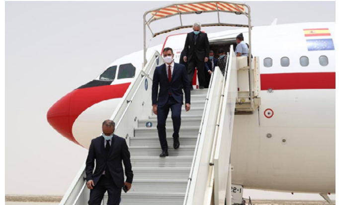
El presidente del Gobierno, Pedro Sánchez, a su llegada a la capital de Mauritania, Nuakchot, en el primer viaje oficial al exterior desde el inicio de la crisis del COVID-19. Uno de los objetivos es hacer entrega de material sanitario al país. Nuakchot (Mauritania) - 30/06/20.

Existen diferentes Acuerdos de Cooperación bilaterales entre ambos Ministerios del Interior , que ha permitido poner en marcha en Nuadibú sendos equipos conjuntos de nuestra Policía Nacional y la Guardia Civil con la Policía y la Gendarmería mauritanas, respectivamente (la Guardia Civil opera con dos patrulleras, un helicóptero BO-105 y periódicamente con un buque oceánico; así como ocasionalmente, un avión de patrulla marítima CN-235 en las labores de apoyo en la vigilancia marítima en coordinación con los Guarda Costas de Mauritania). Además, en mayo de 2014 comenzaron a ponerse en marcha patrullas terrestres conjuntas entre la Guardia Civil y la Gendarmería para la vigilancia de fronteras en el área de responsabilidad de Gendarmería especialmente en Nouadhibou, aumentándose durante el año 2019 a dos componentes más de Guardia Civil para la realización de dichas patrullas. La cooperación hispano-mauritana en la lucha contra la inmigración ilegal ha sido considerada modélica por la UE y sus EE.MM., que aspiran a repetirla en otras zonas. La policía nacional está representada con un equipo de cooperación policial internacional formado por 6 policías de cada parte (12 total). En junio de 2008 se firmó un Memorando entre Mauritania y España para la creación de un Equipo Mixto de cooperación policial (ECI-NDB). Esta