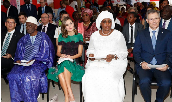
SM la reina Dña Leticia en una visita de cooperación a Senegal. 15/12/017