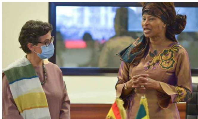
Encuentro entre la ministra de Asuntos Exteriores, UE y Cooperación, Arancha González Laya, y su homóloga senegalesa, Aïssata Tall Sall –Senegal 22/11/2020.