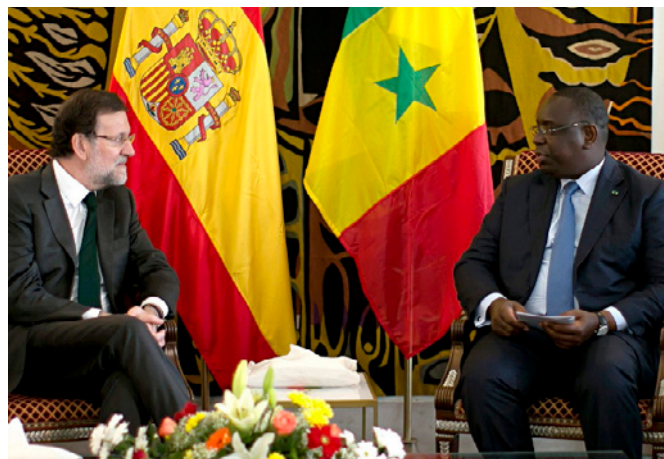
El anterior presidente de Gobierno español, Mariano Rajoy en un encuentro mantenido con el presidente senegalés, Macky Sall, en Dakar. 4/05/2015.- @ EFE

Participó activamente en el establecimiento y ratificación del Estatuto de la Corte Penal Internacional (CPI) en 1998 y su entrada en vigor en 2002, así como en la creación de la Corte Africana de Derechos Humanos y de los Pueblos (ACHR) cuyo Protocolo Adicional a la Carta Africana de Derechos Humanos y de los Pueblos entró en vigor en 2005.